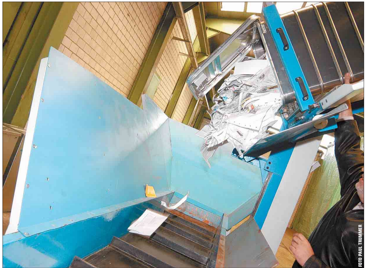
In der Sicherheitshalle der Elkuch Josef AG steht sie: Die vollautomatische Aktenvernichtungsanlage zerstückelt jegliches Papier bis zur Unkenntlichkeit.

Der Betrieb stellt Sicherheitsbehälter mit einem Fassungsvermögen von 240 oder 600 Litern in Miete zur Verfügung. Sobald dieser Behälter voll ist, transportiert ihn ein LKW in die videoüber-